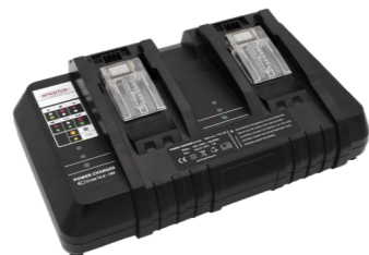
Doppel-Schnellladegerät. Art.-Nr. 119.120