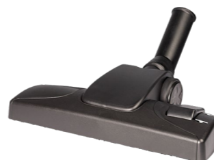
Kombidüse 280 mm Art.-Nr. 114.114