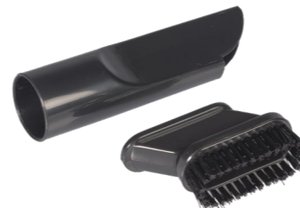
2in1 Fugen- / Polsterdüse. Art.-Nr. 115.127