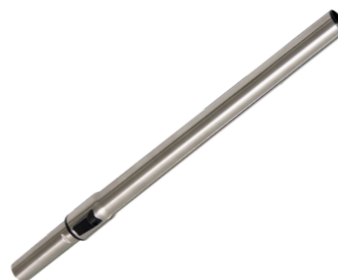
Edelstahl Teleskoprohr 0,6 – 1,0 m. Art.-Nr. 111.133