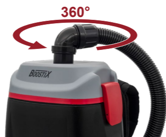
360° Drehgelenk, grenzenlose Beweglichkeit.