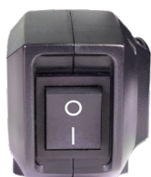
Powerknopf einfach zu erreichen.