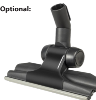
Flachbodendüse 280 mm Art.-Nr. 119.126