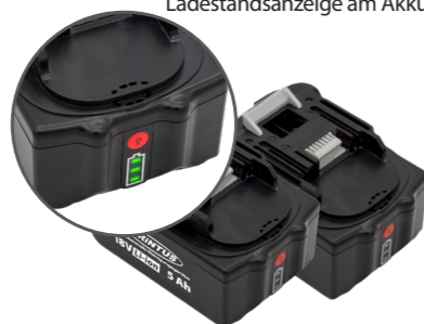
2 x 18 V Li-ion, 5 Ah Akkus. Art.-Nr. 119.121 (einzeln)