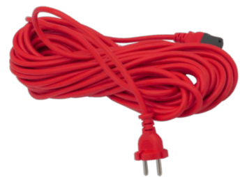
15 m steckbares Netzkabel. Art.-Nr. 119.119