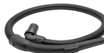
1,3 m Saugschlauch. Art.-Nr. 119.124