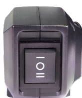
ECO-Modus bei der Akkuversion.