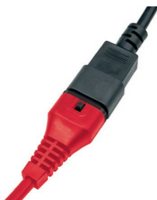
Steckbares Netzkabel und integrierte Kabellsicherung.