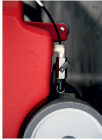
Wassermenge kann individuell auf jeden Bodenbelag eingestellt werden.