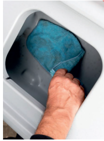
Großer, einfach zu reinigender Schmutzwassertank.