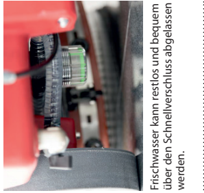
Frischwasser kann restlos und bequem über den Schnellverschluss abgelassen werden.