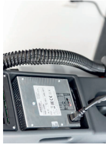
Internes Ladegerät mit Ladestandsanzeige.