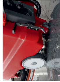
Über das Stützrad kann die Maschine einfach transportiert oder Bürsten schonend abgestellt werden.